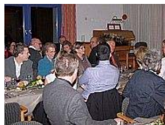
Der neue Parlamentspräsident hatte seine Familie eingeladen.