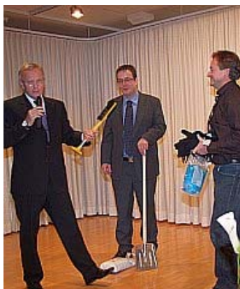
„Winterausrüstung“, ein zweckmässiges Geschenk gegen Steckenbleiben und Schleudern.