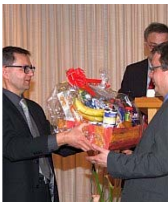
Zur Entlastung des Junggesellenhaushalts gabs von den Parteikollegen eine Kiste voller Lebensmittel.